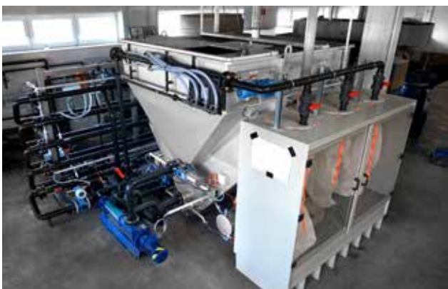
HUBER Druckentspannungsflotation HDF zur Prozessabwasseraufbereitung in einer Lederfabrik.