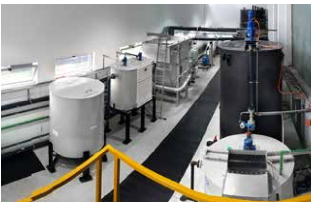
Schlüsselfertige Systemlösung zur Prozessabwasser und -schlammbehandlung in einem Textilunternehmen.