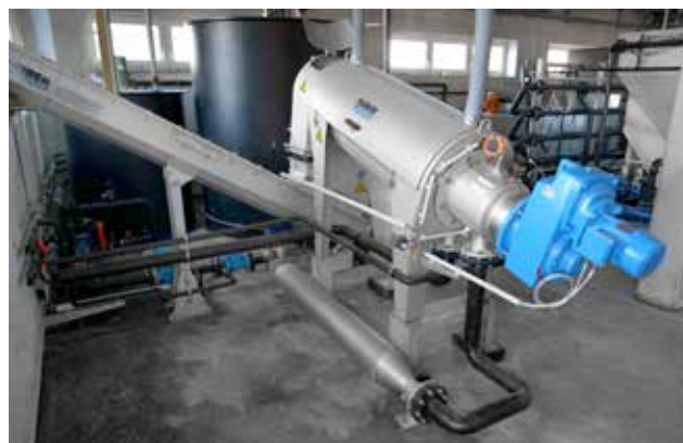
HUBER Schneckenpresse Q-PRESS® zur Prozessschlammwässerung in einer Gerberei.