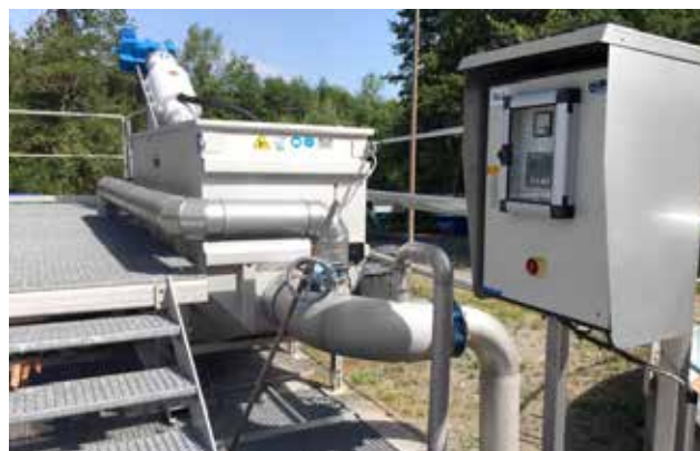
Prozessabwassersiebung zur Textilfaserabscheidung.